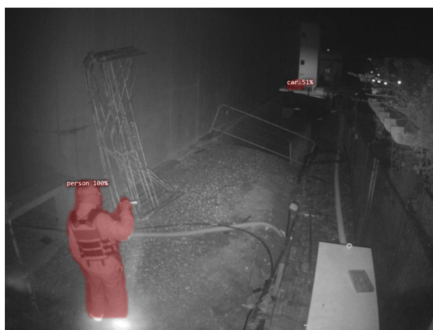
DÉTECTION INTRUSION INFRAROUGE AVÉRÉE