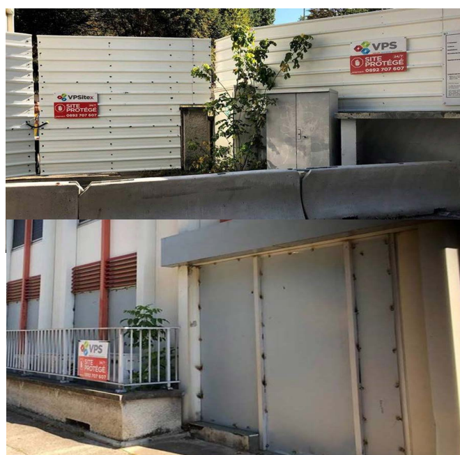
Le sécurisation définitive par procédé de tôleage et de bacs acier sur le pourtour de la clinique Trarieux.

La clé du succès réside dans la capacité de VPSitex à proposer des solutions alternatives et successives selon le contexte d'urgence. Malgré les différentes tentatives d'intrusions malveillantes, le travail des équipes VPSitex a permis de faire la différence grâce aux solutions mixtes (gardiennage humain et sécurisation électronique). La réactivité et la vigilance accrues des équipes permettent, encore à ce jour, de préserver l'état du bien en attente du futur projet de réhabilitation ou démolition.